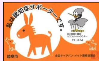
●認知症サポーターカード

☆新型コロナウイルス感染症の緊急事態宣言等が発令中の場合は中止とします。その際は予約された方に電話でご連絡します。