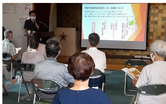
認知症サポーターさん